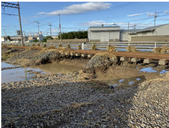
【写真①】佐野線 渡瀬～田島間 線路碎石流出